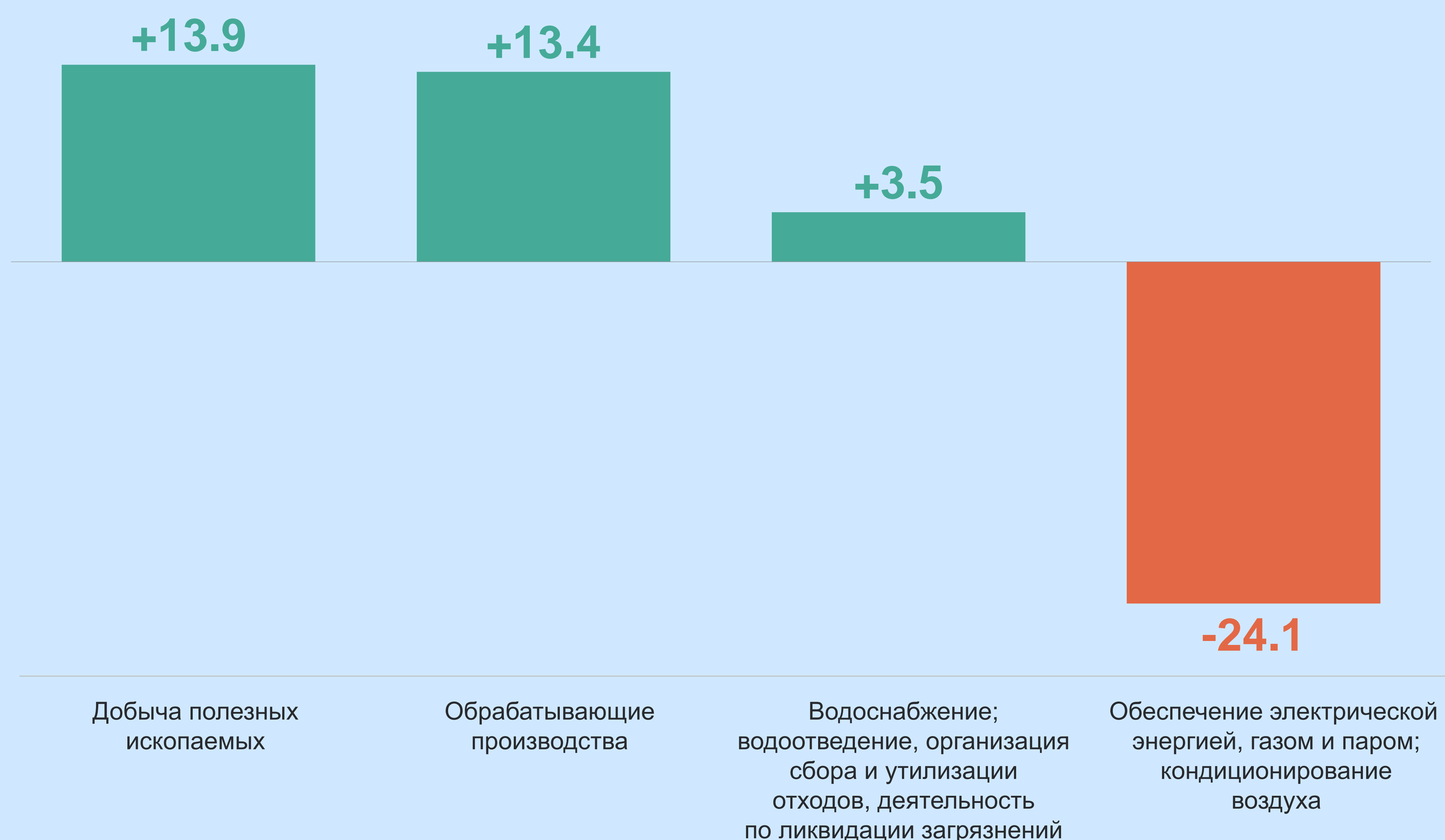
Объём промышленного производства в январе – феврале 2024 года по сравнению с январем – февралем 2023 года, в %